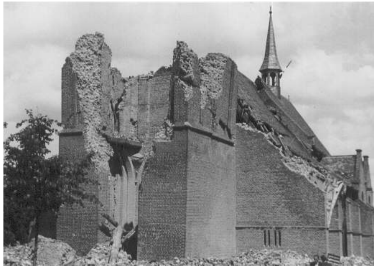
De opgeblazen toren van de Ned. Hervormde kerk in Scherpenzeel

Op 22 april 1945 is de kerktoren van de Nederlands Hervormde Kerk in Scherpenzeel opgeblazen en op 29 april 1945 ging de molen bij de Holevoet de lucht in. Op 5 mei 1945 kwam de bevrijding voor heel Nederland.