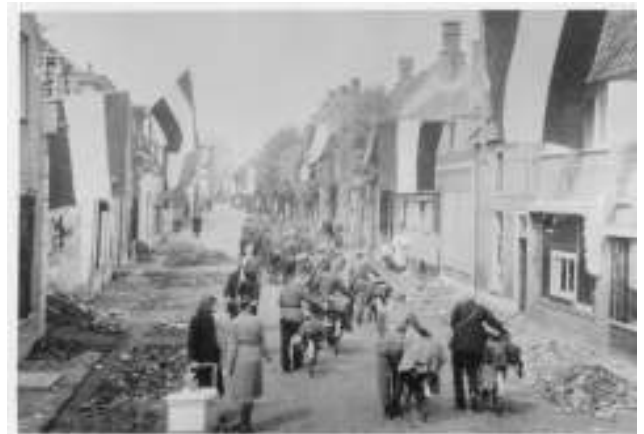
Woudenberg is vrij. Duitsers trekken weg.