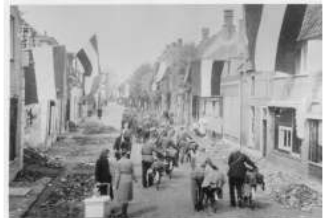
Woudenberg is vrij. Duitsers trekken weg.